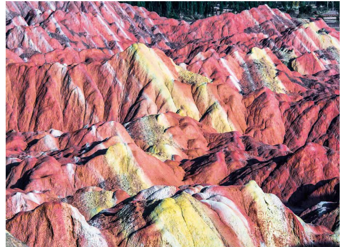
Xania Gebirge, China

Die folgerichtige Frage lautete: Gibt es Quellen des Lichts im menschlichen Körper?